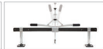
Barra di tiraggio PREMIUM - 1200 mm Rif. 059313