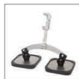
Cuscinetto corto a doppio piede Rif. 059344 Rif. 059351 (x2)