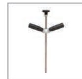
Asta per barra corpo auto Rif. 059399