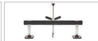
Barra di riparazione ammaccature PREMIUM Rif. 059306