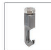
Gancio a 2 denti Rif. 059382 Gancio a 3 denti Rif. 059658