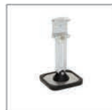
Breve piede singolo Rif. 059320