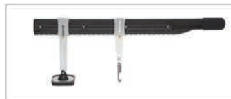
Leva di riparazione ammaccature PREMIUM Rif. 059290