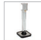
Lungo piede singolo Rif. 059337