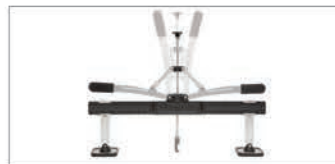
Barra di tiraggio PREMIUM Rif. 058996