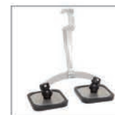
Pattino lungo doppio piede Rif. 059368 Rif. 059375 (x2)